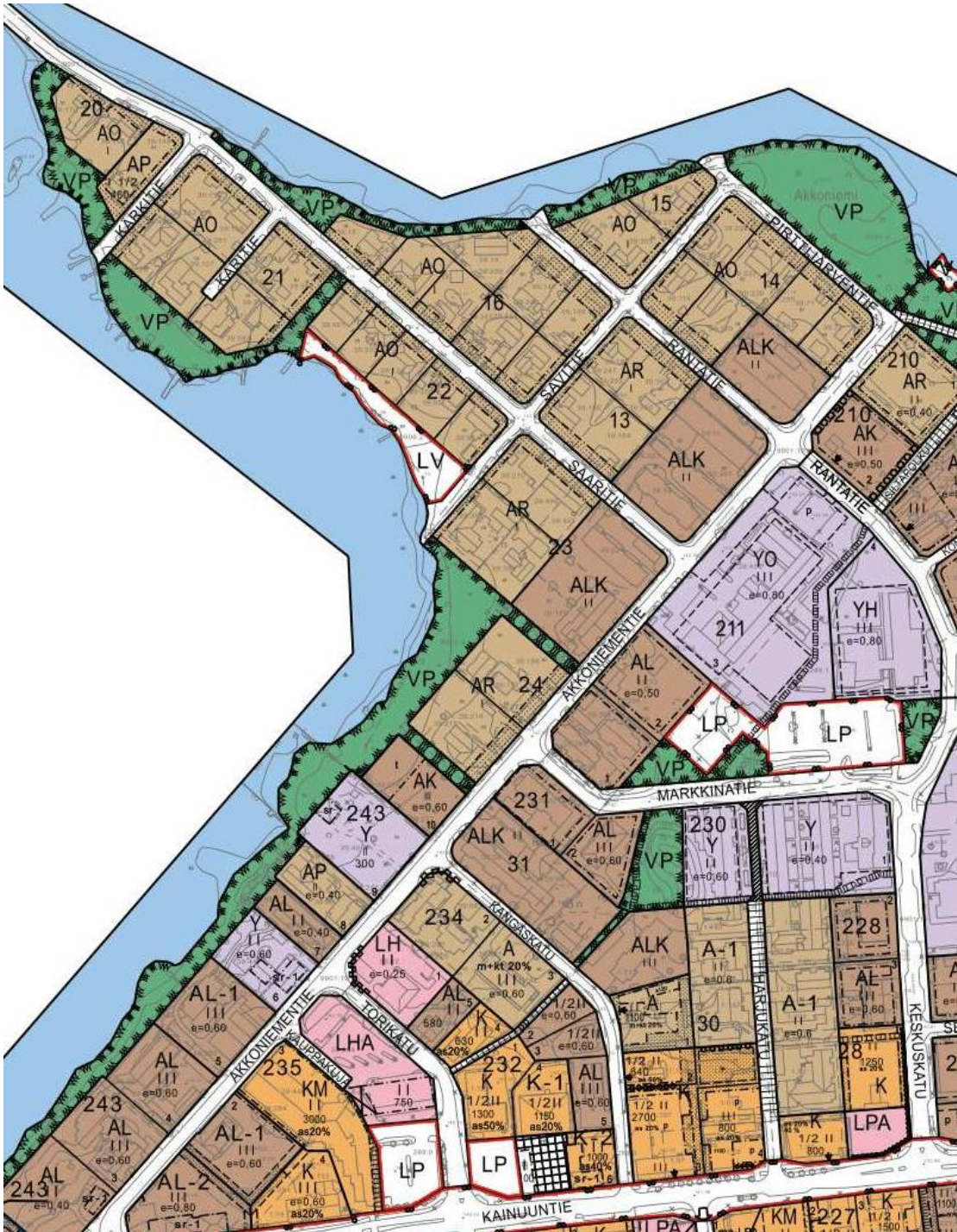
Kuva 3. Ote asemakaavayhdistelmästä.