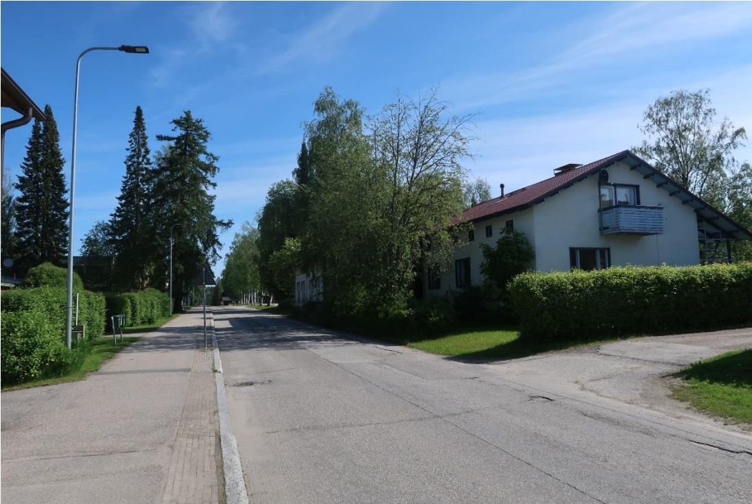
Kuva 6. Hetilä.