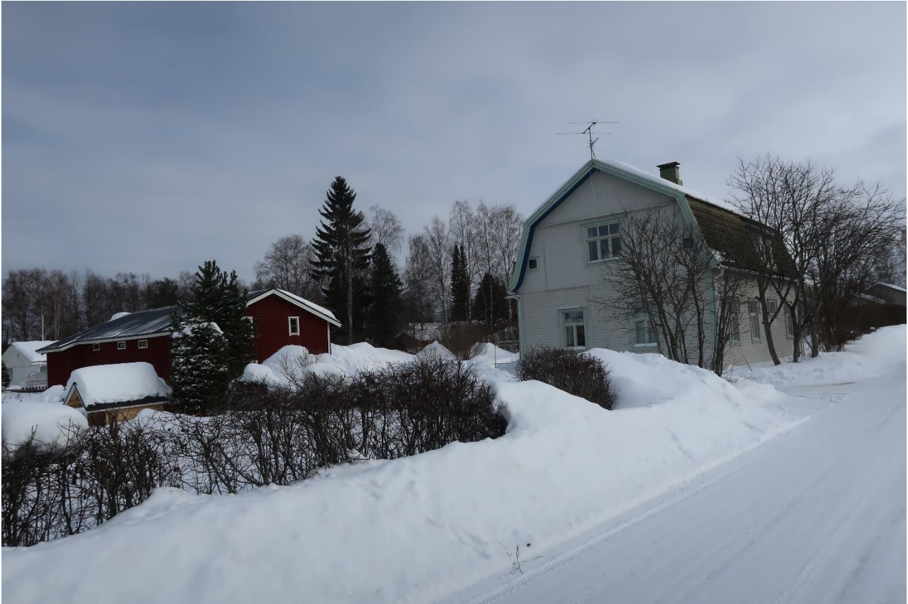
Kuva 7. Koivula.

Näiden rakennusten lisäksi Sotkamon kulttuuriympäristöohjelmassa mainitaan Rantalán jugend -tyylinen leikkimökki, mutta tämä rakennus on siirretty, eikä ole enää asemakaavoitettavalla alueella.