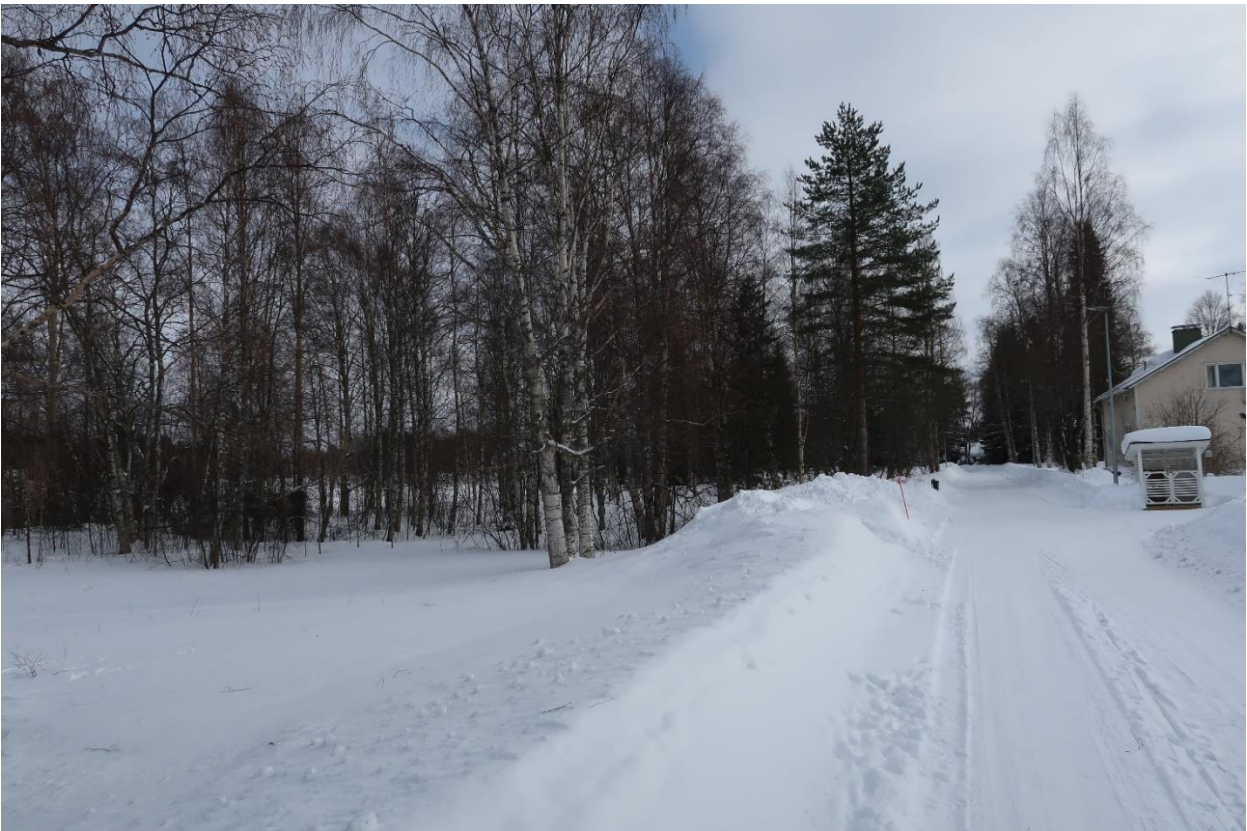
Kuva 5. Pieni luonnontilainen puistoalueen osa hoidetun puiston keskellä Akkoniemessä.

Muiston laatimisen jälkeen hoidetun alueen osuus Akkoniemen puistossa on kasvanut, mutta muutoin olosuhteissa ei ole tapahtunut muutoksia.