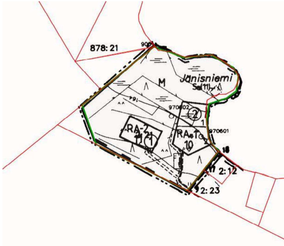
Muutettavan kaavan osa. Kiinteistöjaotus vastaa tilannetta 2.2.2026.